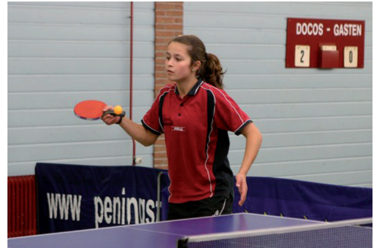
Competitiedag bij Docos op zaterdag 16 oktober 2010